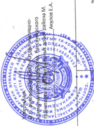
Календарный план график работ Текущий ремонт уличного освещения с. Полудино